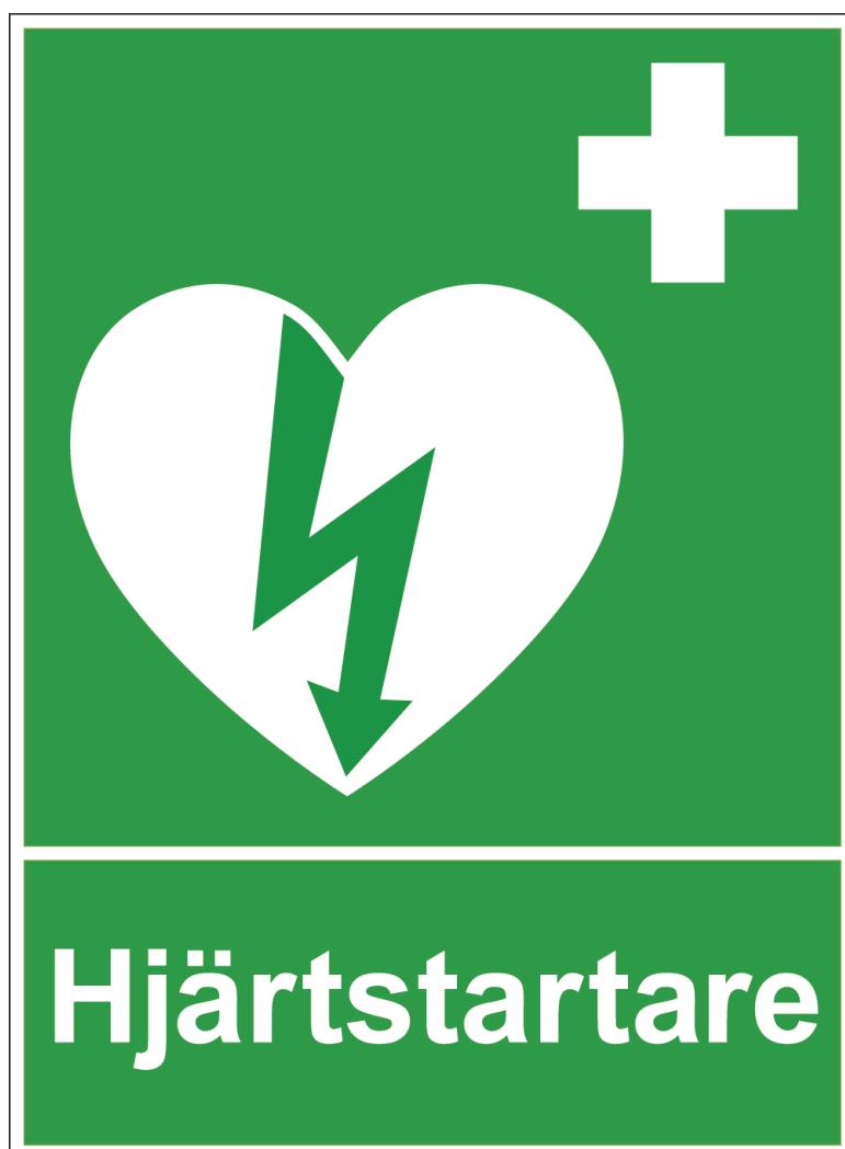
Grundskylt Storlek: 170 x 230 mm

Flaggskylt I den händelse man vill påvisa plats för hjärtstartaren i t ex en korridor eller utmed en vägg. Skylten fästes med lämpligt väggfäste ut från vägg (enligt fig). Obs! Dubbelsidig